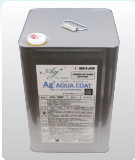
型式: NYU-1000C NET: 14Kg 水性アクリル樹脂系エマルジョン塗料