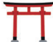
鳥居などの木製品