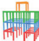
ジャングルジムなどの 鉄製の遊具