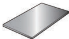
鉄板などの金属類